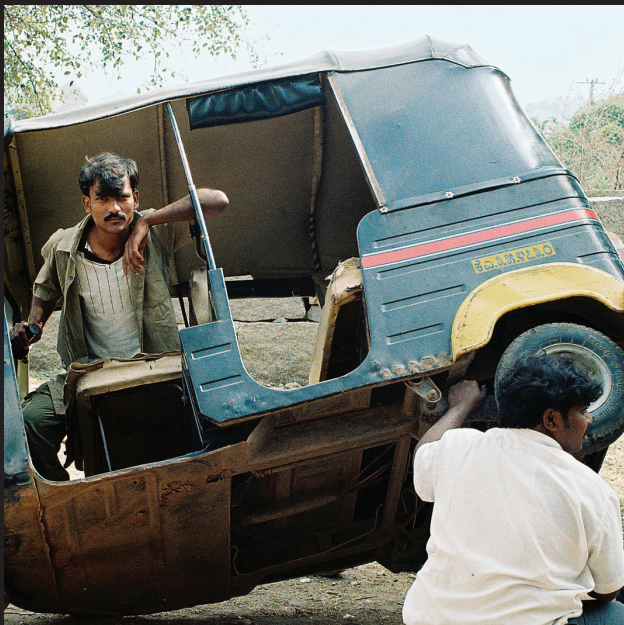
Profesionálny pozér – ani naklonená rikša mu nepohne s ofinou! Hampi, Karnataka.