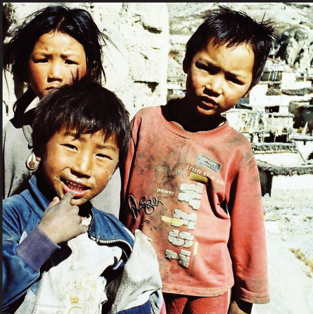
Decká v nekomerčnej dedinke Jhong v dolnom Mustangu. Odbočka z hlavnej trasy vždy prináša najväčšie vibrácie.