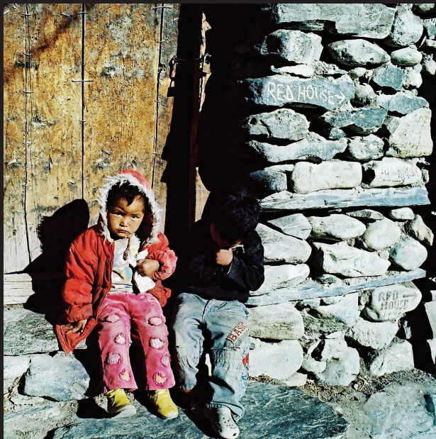
Bábo v Kagbeni, dolný Mustang.