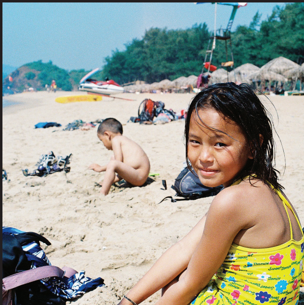
Sushila v Goa.