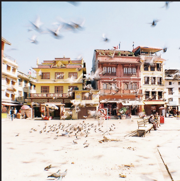
Boudhanath v Káthmandu. Tibet v Nepále. Sväté budhistické miesto.