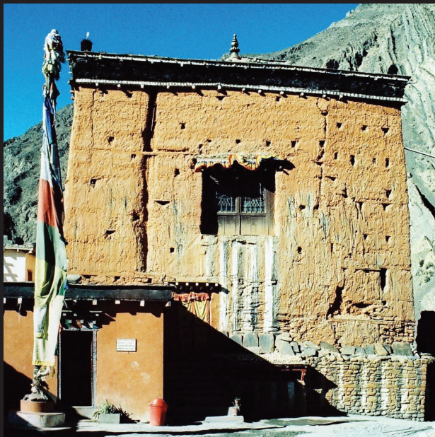
Päťstoročný kláštor v Kagbeni. Silné miesto.