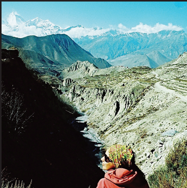
Vyhliadka na osemtisícovku Dhaulaghiri. Kúsok od Muktinathu.