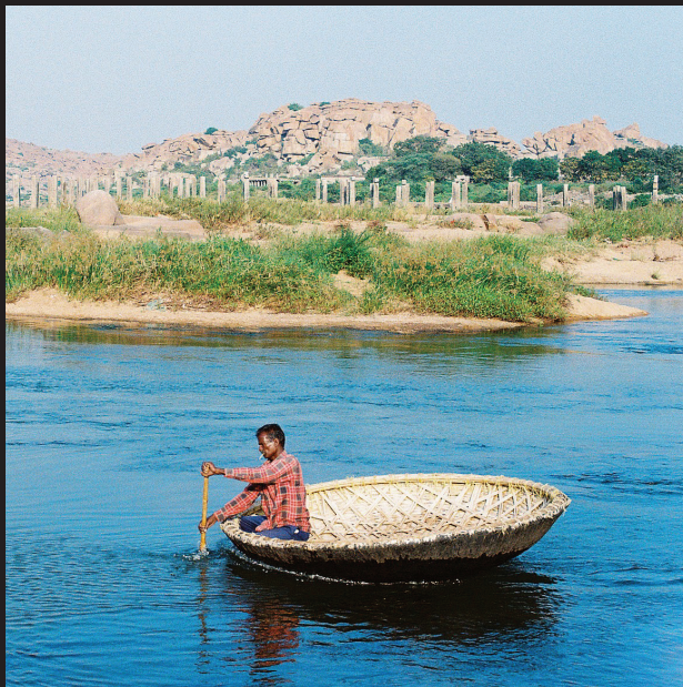
Prievozník v malebnom košíku – lodičke. Hampi, Karnataka.