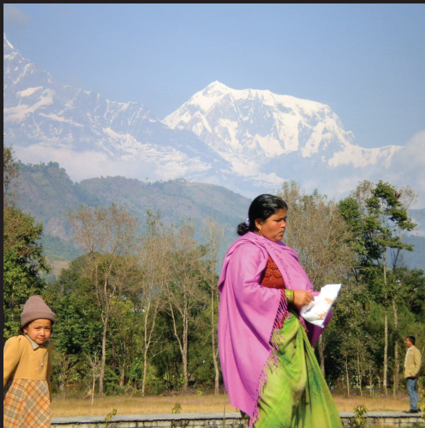
Kriváň Nepálu – špicatý svätý kopec Machhapuchare. Pokhara, Nepál.