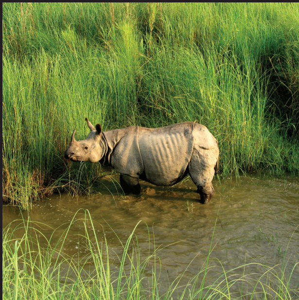
Nosorožec odfotený zo slonieho chrbta.