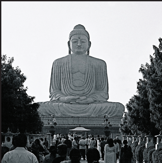
Gigantická socha Buddhu v Bohgaji, štát Bihár.