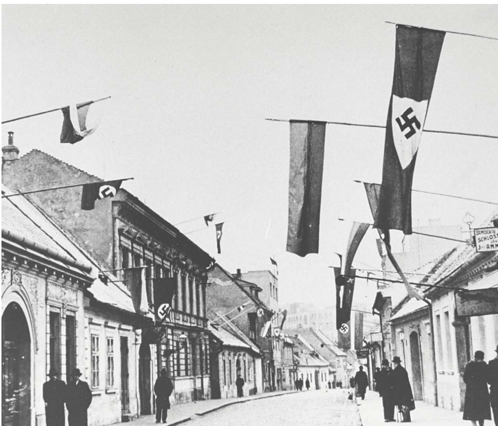
Ulica Vysoká v Bratislave s nacistickými a slovenskými vlajkami pri prípravách na voľby do Snemu Slovenskej krajiny, december 1938.