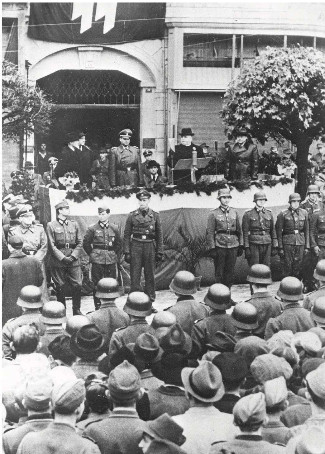
Námestie Andreja Hlinku v Banskej Bystrici, tri dni po obsadení mesta nacistami. Prezident Jozef Tiso dekoruje nemeckých vojakov vyznamenaniami za potlačenie Slovenského národného povstania, 30. októbra 1944.