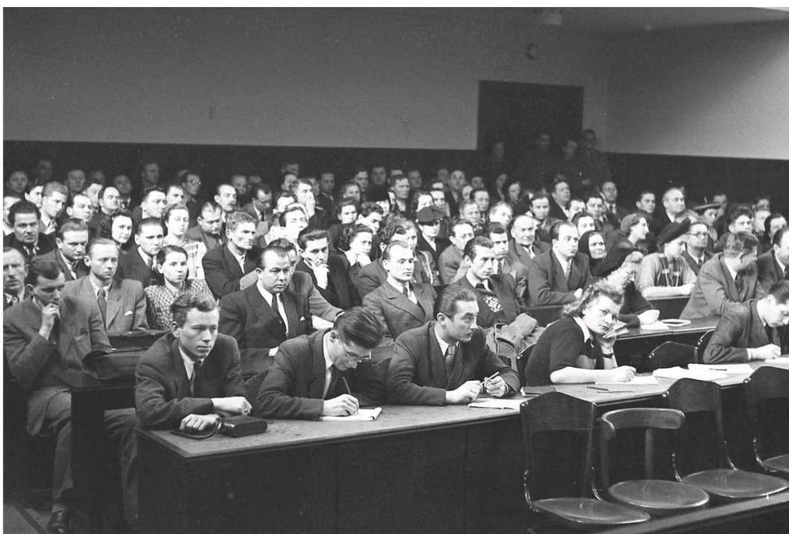
Preplnená súdna sieň Národného súdu, 18. marec 1947.