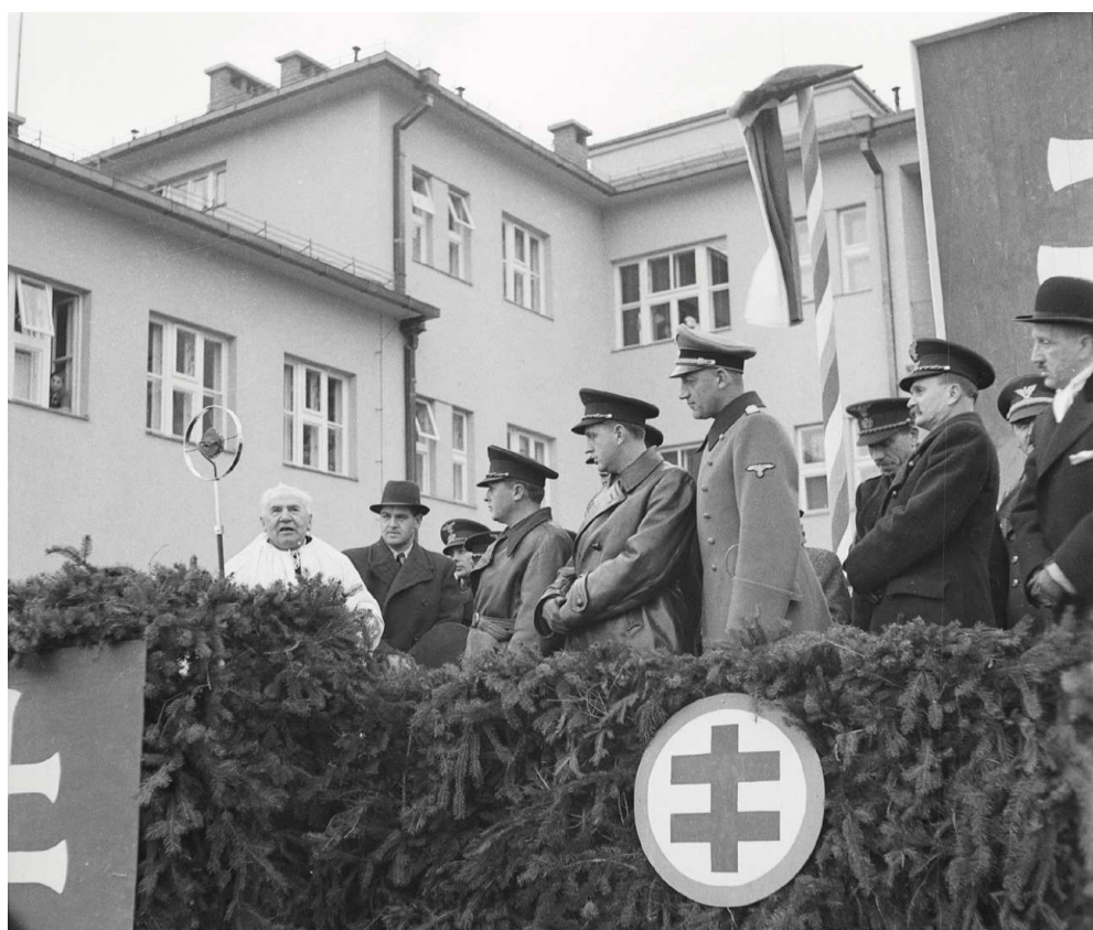
Machovi pri oslovovaní obyvateľstva pomáhali rôzni aktéri na miestnej úrovni vrátane kňazov. 1. december 1940.