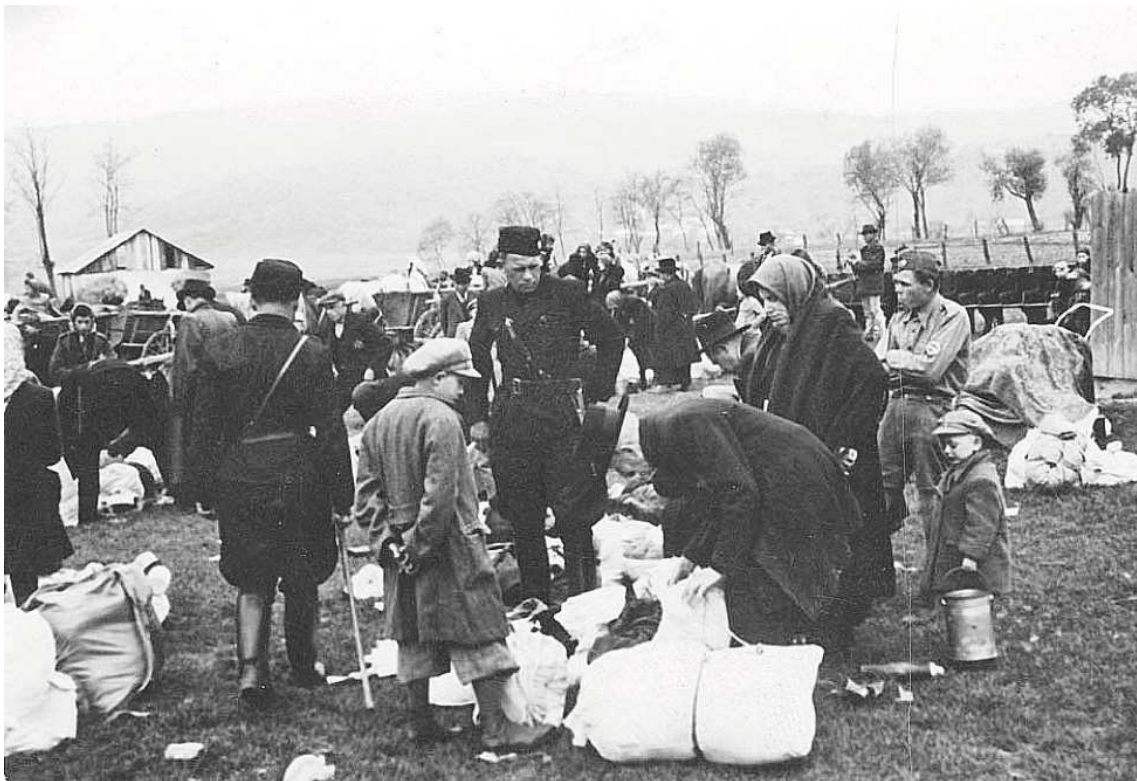
Židia so svojimi osobnými vecami krátko pred deportáciou. Medzi zhromaždenými vidieť žandárov aj gardistov, ktorý dohliadajú na priebeh udalosti, 1942. fotografia č. 1585/99.