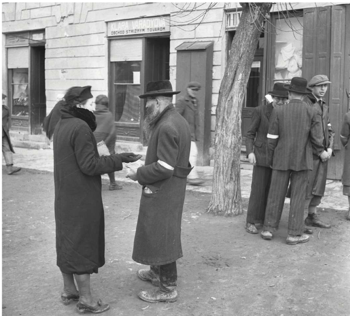
Židia so Šariško-zemplínskej župy so žltou páskou. Regionálne nariadenie predchádzalo zavedeniu podobného opatrenia na celoštátnej úrovni, marec/apríl 1941.