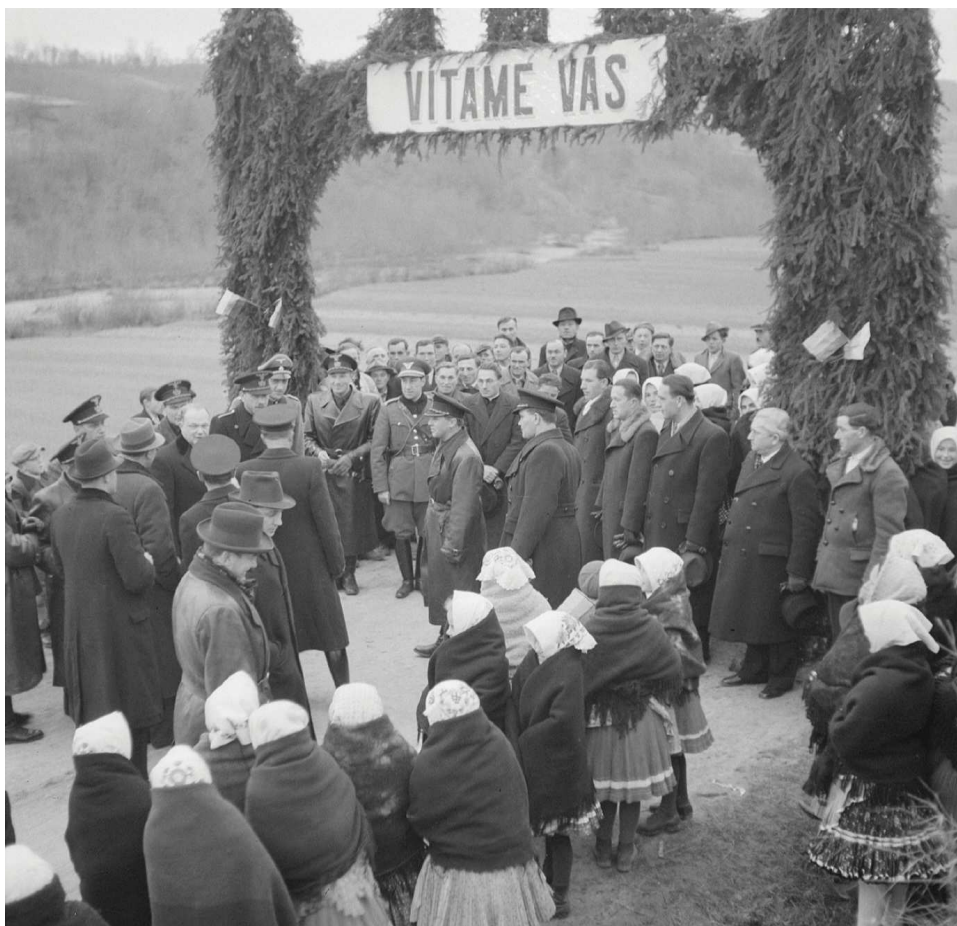
Návšteva ministra Alexandra Macha v Šarišsko-zemplínskej župe, 1. december 1940.