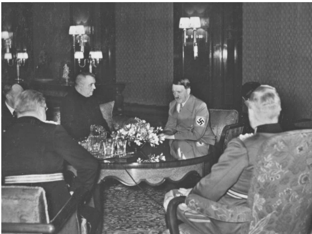
Jozef Tiso a Ferdinand Durčanský s Adolfom Hitlerom v Berlíne, 13. marec 1939.

Oddelenie umenia, grafiky a fotografií Miriam a Ira D. Wallach - obrazová zbierka, New York Public Library. Digitálne zbierky New York Public Library.