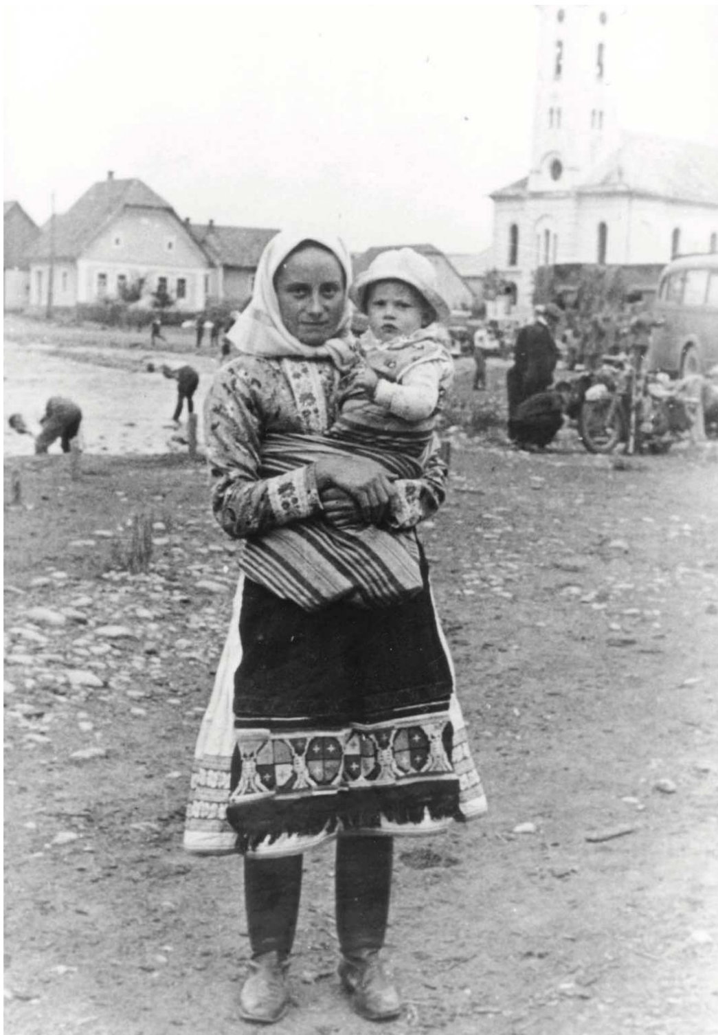
Z albumu nemeckého vojaka: rómska žena zo Slovenska v tradičnom ľudovom kroji s dieťaťom.