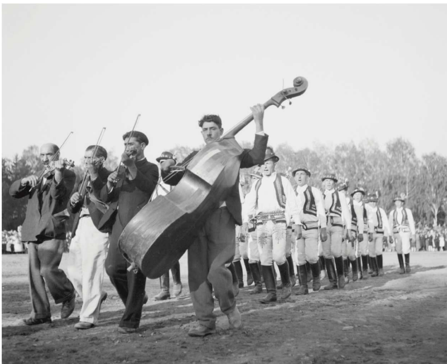
Rómski hudobníci vystupujúci na dožinkovej slávnosti v Prešove, 25. august 1940.