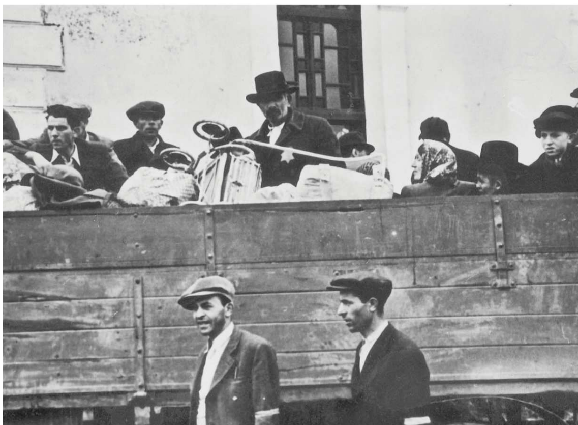
Deportácie Židov prebiehali verejne, pred očami širokej verejnosti, 1942. Fotoarchív Jad Vašem, Jeruzalem, fotografia č. 1585/140.