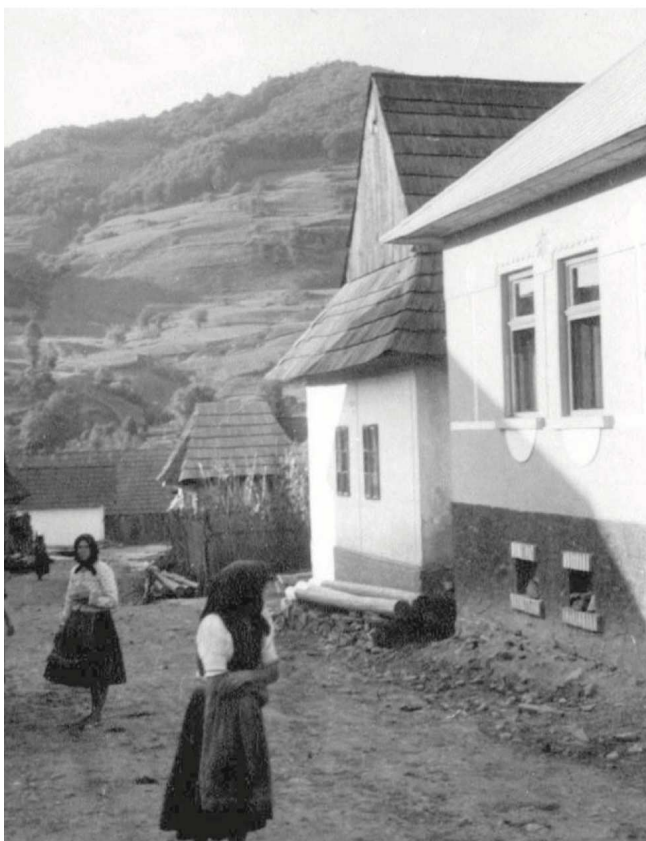
Dedinčania na ulici, august 1939. V ich životoch sa odráža prostá každodennosť periférie, neraz označovanej za zaostalú.