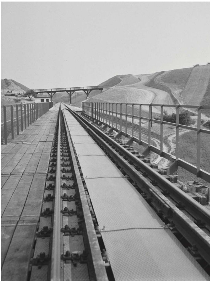
Nová železničná trať Prešov - Strážske, 25. / 8. august 1943.

Ministerstvo vnútra Slovenskej republiky, Slovenský národný archív, fond STK, fotografia č. 21543.