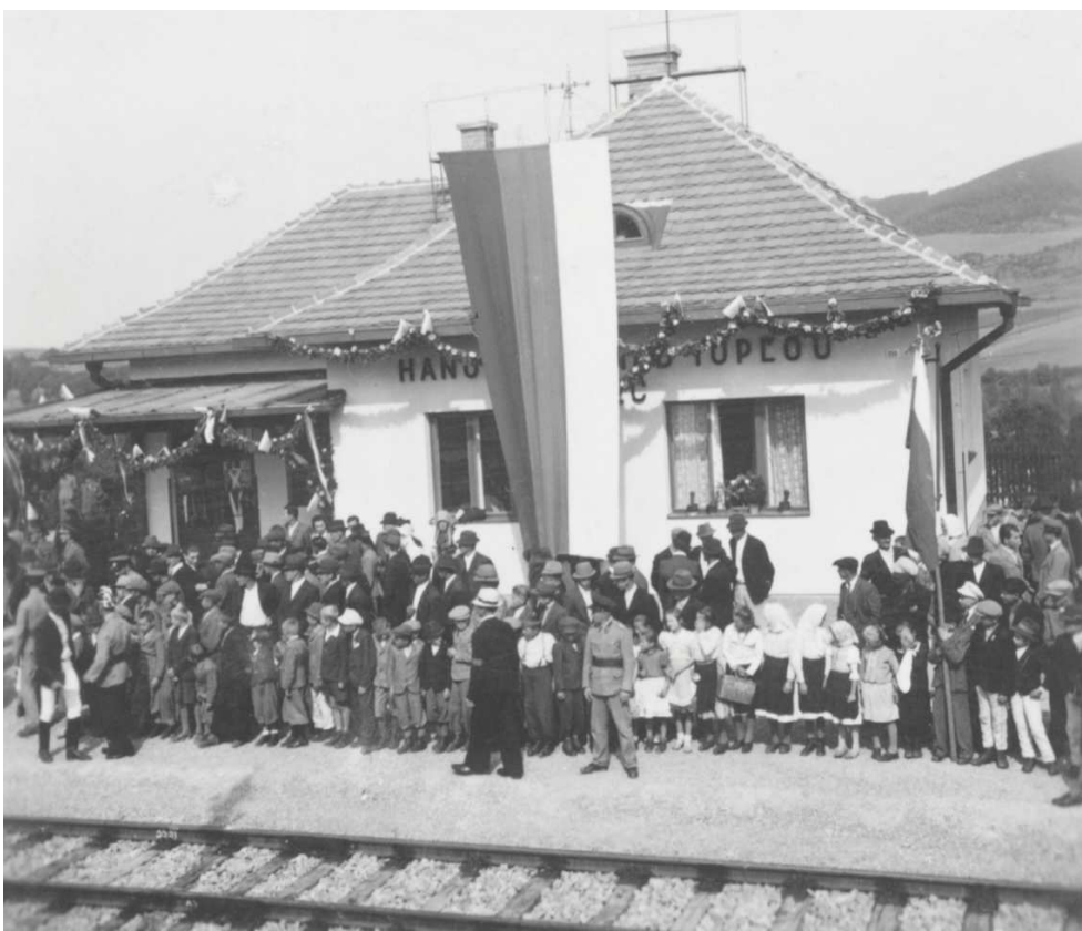
Obyvatelia Hanušoviec nad Toplou sa zhromažďujú, aby privítali prezidenta Jozefa Tisa, pravdepodobne v roku 1943.