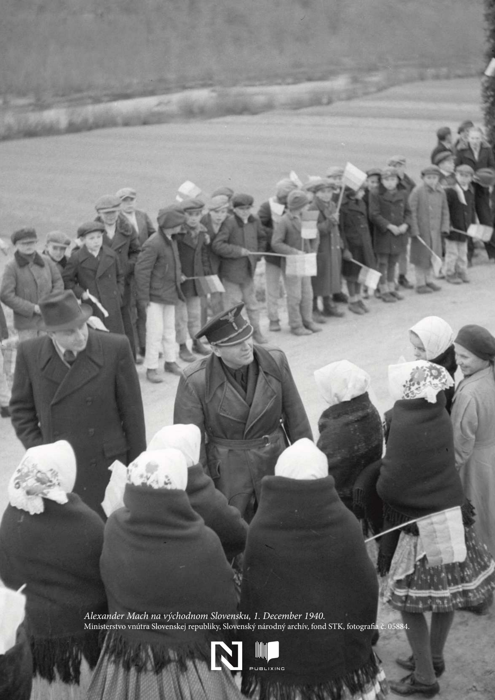
Alexander Mach na východnom Slovensku, 1. December 1940.

Ministerstvo vnútra Slovenskej republiky, Slovenský národný archív, fond STK, fotografia č. 05884.