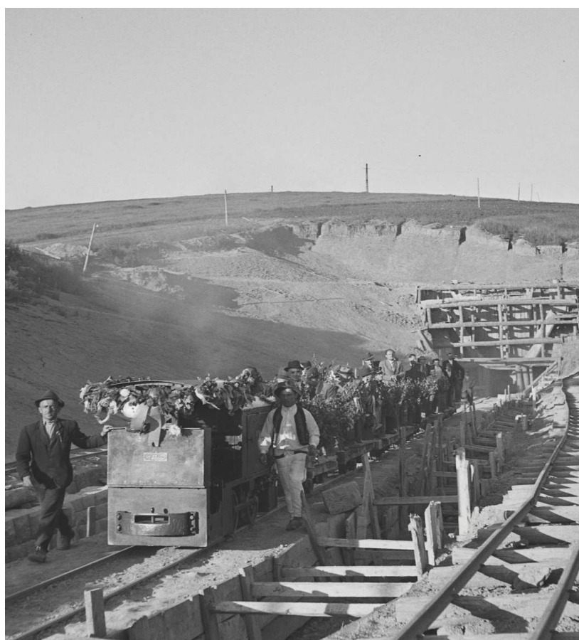
Otvorenie železničného tunela Pod Petičom, ktorý z veľkej časti postavili miestni Rómovia, 6. júl 1942.

Ministerstvo vnútra Slovenskej republiky, Slovenský národný archív, fond STK, fotografia č. 18443.