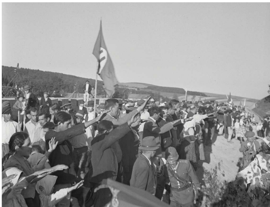
Prezident Tiso na návšteve pracovného útvaru v Hanušoviciach nad Topľou, 6. júl 1942.

Ministerstvo vnútra Slovenskej republiky, Slovenský národný archív, fond STK, fotografia č. 18443.